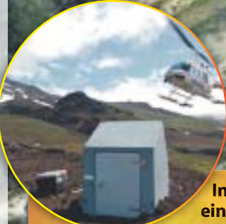
In solch einer kleinen Messstation befinden sich viele Geräte, die den Vulkan genau beobachten. Zum Beispiel kann jede winzige Erschütterung und Bewegung aufgezeichnet werden.