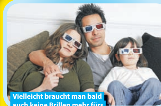
Vielleicht braucht man bald auch keine Brillen mehr fürs 3-D-Fernsehen zu Hause.

Heute gibt es fast überall auf der Welt Fernseher. Viele Menschen können deshalb zeitgleich große Ereignisse wie zum Beispiel Olympische Spiele sehen. Doch keine TV-Übertragung hatte bisher mehr Zuschauer als die Beerdigung von Michael Jackson am 7. Juli 2009. Laut Guinnessbuch der Rekorde sahen über 2 Milliarden Menschen die Trauerfeier für den Sänger.