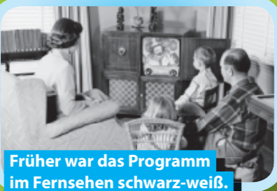
Früher war das Programm im Fernsehen schwarz-weiß.