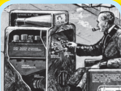
Kleiner Bildschirm auf großem Kasten: So sah 1925 einer der ersten Fernseher aus.

Könnt ihr euch ein Leben ohne Fernsehen vorstellen? Ohne spannende Kindersendungen, live übertragene Fußballspiele und Unterhaltungsshow am Samstagabend? Zugegeben: Das ist ganz schön schwer. Denn zu unserem Alltag gehört das Fernsehen fest dazu. Doch es dauerte lange, bis es so weit kam.