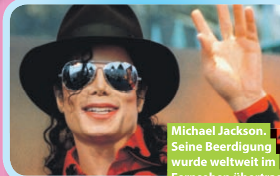
Michael Jackson. Seine Beerdigung wurde weltweit im Fernsehen übertragen.

Riesig! Für diesen Fernseher braucht man viel Platz. Er ist laut Hersteller der größte der Welt. Sein genauer Preis ist nicht bekannt. Aber er soll etwa so teuer sein wie ein Einfamilienhaus.