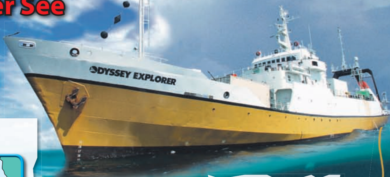
Auf dem großen Foto ist die Odyssey Explorer abgebildet. Sie ist 76 Meter lang und das wichtigste Schiff der Schatzsucher-Firma Odyssey Marine Exploration aus den USA.