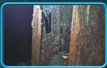
Das Schiff ist teilweise zerstört. Hier ist eine Toilette mit WC zu sehen.

Die Schatzsucher entdeckten das Wrack mit einem Gerät, das Sonar heißt. Später seilten sie einen gelben Tauchroboter von ihrem Schiff ab. Er hat die Fotos gemacht, die ihr rechts seht.