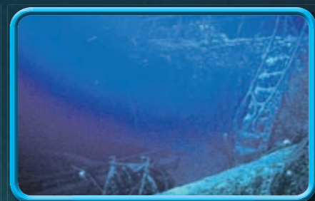
Rechts seht ihr eine Treppe zum Vorderdeck, links eine Ladeluke.