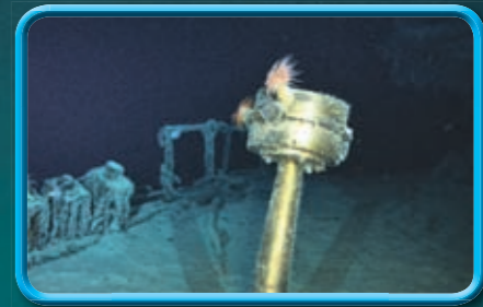
Hinten auf dem Schiff: Hell leuchtet der Sternkompass im Kameralicht.