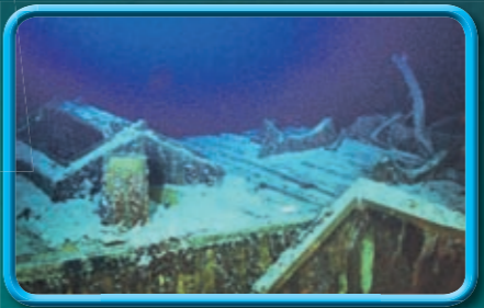
Auf diesem Bild erkennt man links die Dachluke vom Maschinenraum.